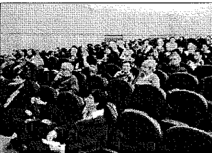
Una vuitantena de veïns hi assistiren a les dues primeres

També va remarcar que malgrat no totes les persones en dol volen o necessiten un grup, molt sovint aquest espai sembla proveir un recolzament únic on les seves necessitats són escoltades i elaborades.