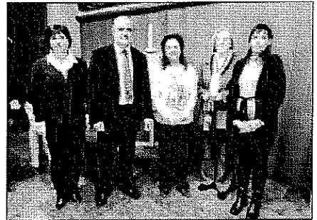
La valoració del cicle és de moment molt positiva